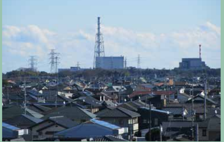
東海第二原発(左)と廃炉措置中の東海原発(右)

2011年3月に発生した福島第一原発事故から6年が経過します。この間、日本国内の大部分の原発は停止していましたが、新しい規制基準が導入されて以降、西日本の原発から順次、川内、高浜、伊方と再稼働を始めています。そして今年は玄海原発が動き出そうとしています。まるで福島第一原発事故を忘れたかのように。一方で、熊本発の連続地震に見られるように、3.11以降も、日本周辺では活発な地震活動が続いています。